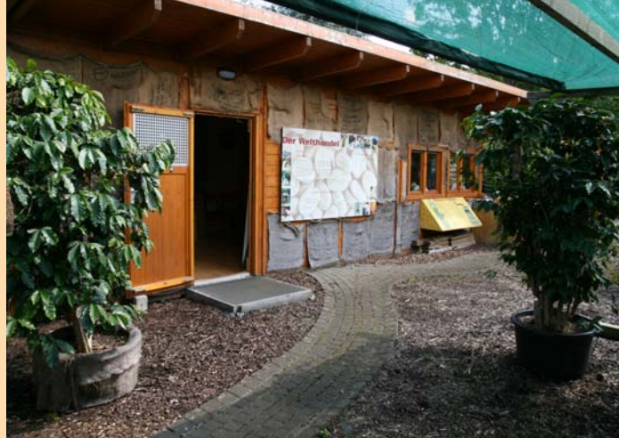
Ein stabiles Holzhaus...

Hier ist zu sehen, wie sich der Kaffeegarten bisher im Rahmen der Baumschule Toni Selders in Neuss präsentierte