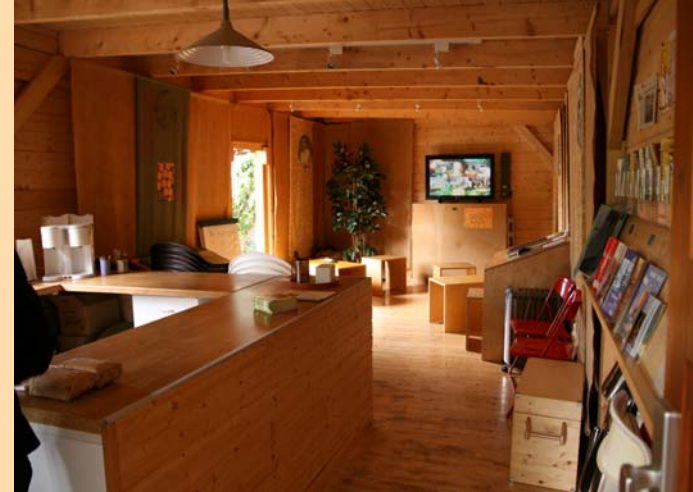
...mit Küchentheke, Grossbild-TV, Web-Station