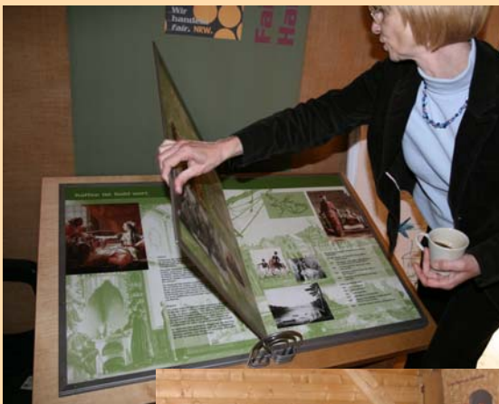
Das große Kaffee-Geschichtsbuch und der Grossbild-Fernseher mit abrufbaren Kaffeefilmen