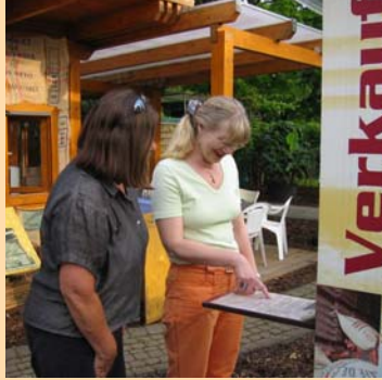
Die Kaffee-Weltkarte mit Magnettechnik