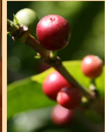
Reife, rote Kaffeekirschen und die prächtigen Kaffeebäume